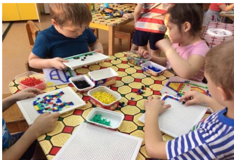
Центр творческой деятельности