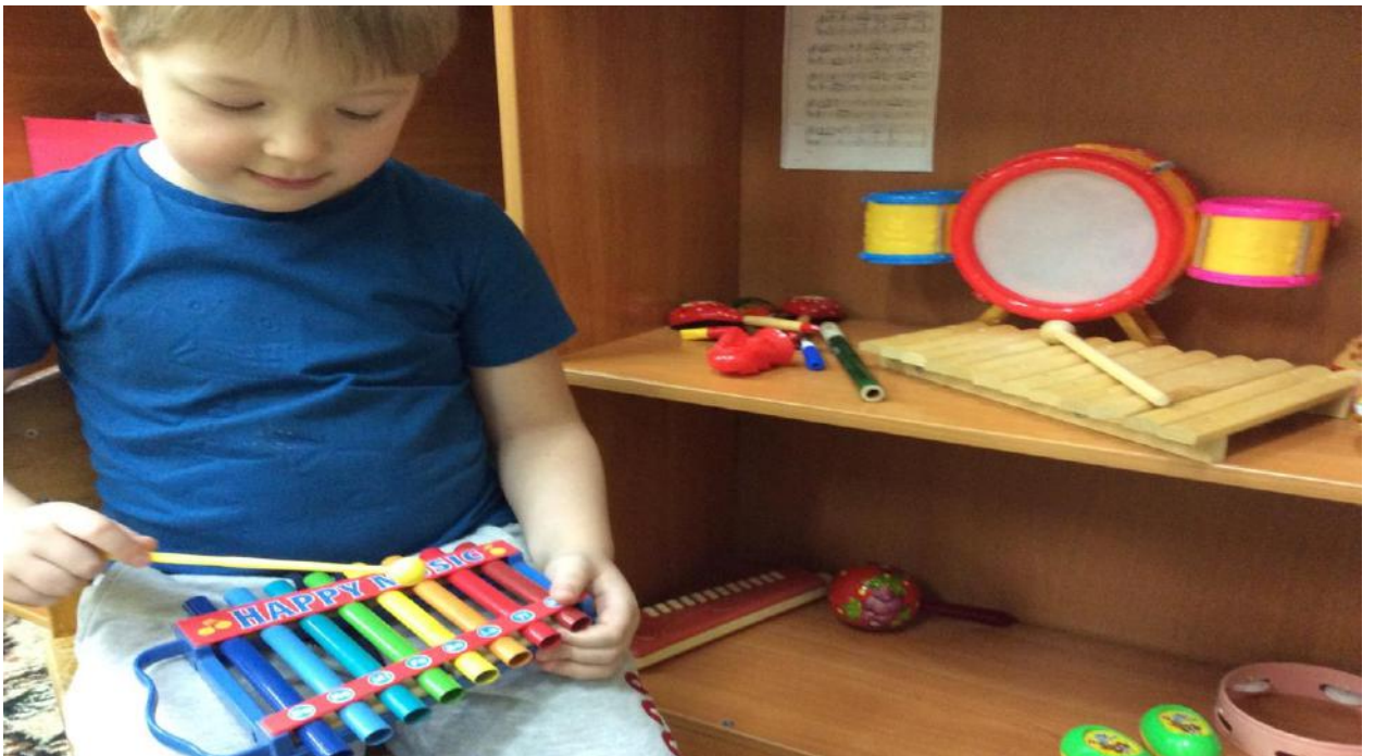
Центр отдыха и уединения