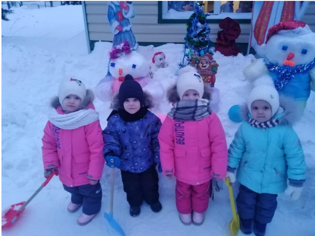
Участие в сельском конкурсе в номинации «Новогодний коллектив» (совместная деятельность детей с родителями, воспитателями).