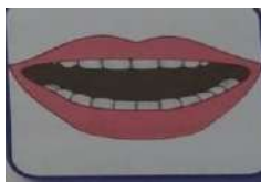
Зубы на маленьком расстоянии.